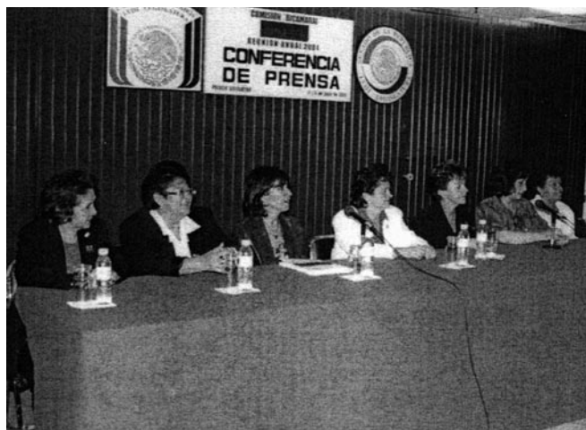
Comisión de Equidad y Género, LVIII Legislatura, Conferencia de prensa, 2002.

“Fue un retroceso increíble, producto de ello, ante el reclamo de la sociedad civil por un lado y de la Comisión por otro, se hicieron acciones más completas para que, en la negociación 2007, se lograra alcanzar un presupuesto 2008 mínimamente justo y un gasto etiquetado para las mujeres”, señaló. Así, la sociedad civil organizada empezó a formar parte de las gestiones para tener un presupuesto con perspectiva de género y un aumento de recursos.