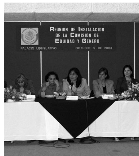
Instalación de la Comisión de Equidad y Género, LIX Legislatura, 2003.

Actualmente, en el ámbito global, alrededor de 33 millones de personas viven con el virus, de las cuales 1.6 millones son latinoamericanas, menciona el informe de ONUSida. También señala que ha disminuido la propagación del vi-