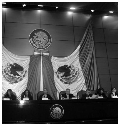
Comisión de Equidad y Género, Congreso Nacional Legislativo a Favor de las Mujeres, noviembre 2008.

Los legisladores fueron reticentes a aceptar la invisibilidad de 52 por ciento de la población mexicana, al reconocimiento de su utilización como meros objetos decorativos sexuales, limpiando el camino al hombre para sentar en el poder al varón.