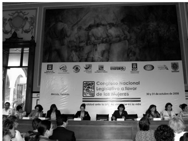
Comisión de Equidad y Género, Congreso Nacional Legislativo a Favor de las Mujeres, Merida, Yucatán, 2008.

Además, el fortalecimiento a las organizaciones sociales que brindan atención, que los equipos de las organizaciones junto con el Legislativo y el Ejecutivo establezcan un comité coordinador interdisciplinario para que las acciones no se lleven a cabo de manera aislada; que las propuestas entregadas en el Congreso sean presentadas por las y los diputados de sus respectivos estados y que, a la par de las reformas legislativas, se incluyan los códigos de procedimientos para cerrar la pinza y hacer efectivos en la realidad los cambios legislativos.