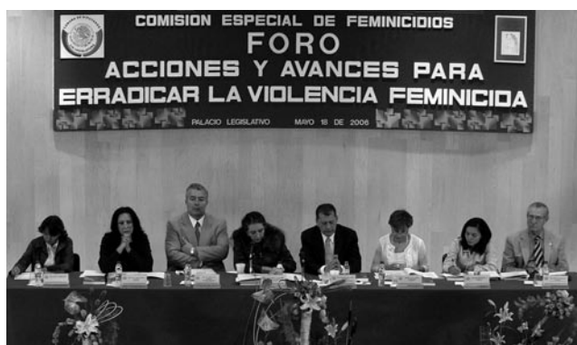
Foro de Acciones y Avances para Erradicar la Violencia Feminicida, Comisión de Equidad y Género, LIX Legislatura.

En tanto, la estrategia para combatir la pandemia de VIH-Sida en México es erradicar su transmisión por vía perinatal, pues son prevenibles totalmente. No obstante, en 2007 sólo 18 por ciento del promedio mundial de mujeres gestantes se hicieron la prueba de detección de VIH y, de las que resultaron positivas, sólo 33 por ciento tuvo acceso a tratamiento para evitar el contagio del virus a sus hijas e hijos. ●