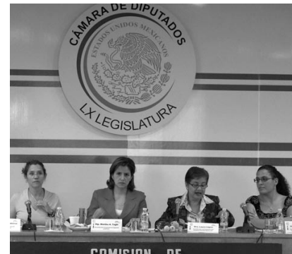
Evaluación de mujeres municipales, 15 de octubre 2008.

“Entonces, ante una realidad que muestra una discriminación de género no queda otro camino que el empeño por lograr que sea revertida” afirma.