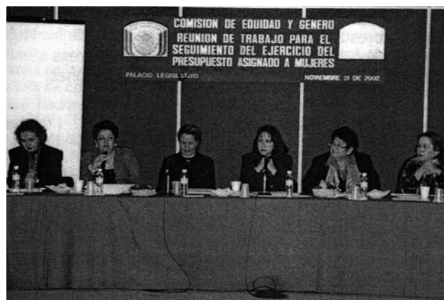
Reunión de trabajo de la Comisión de Equidad y Género, LVIII Legislatura, 2002.

Las propuestas que realizó la Coalición fueron apoyadas y resultaron en el Artículo 25 del Decreto