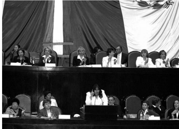
Comisión de Equidad y Género en el Pleno, LIX Legislatura.

mundo, por cada mil condones para hombre, sólo hay tres para mujeres, esto representa un obstáculo para la prevención. En los últimos seis años, por discriminación y violencia, once mil mujeres más viven con VIH-Sida,