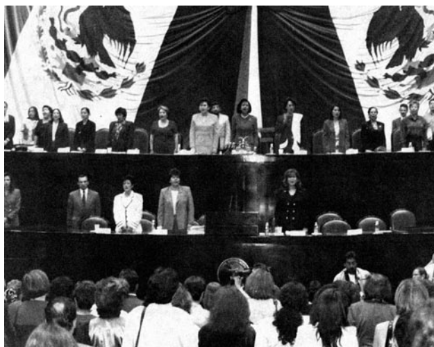
Comisión Especial para Asuntos de Equidad y Género, LVII Legislatura, Clausura de Trabajos del Parlamento de Mujeres, 1998.

Infantiles. El resto corresponde a variaciones de los diferentes programas y actividades”.