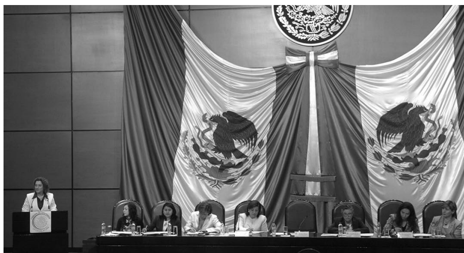
Comisión de Equidad y Género, LX Legislatura, 2007.