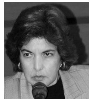
Dip. Silvia Luna Rodríguez NA LX Legislatura

Una mujer con un mayor nivel de educación se inclinará a tener pocas hijas (os), les fomentará el interés por la educación y contribuirá a que las futuras generaciones favorezcan la formación de una mejor sociedad. En los países en desarrollo la educación de las mujeres y su capacitación constituye un medio eficaz para combatir la pobreza y la desigualdad de género, por ello la educación es un espacio a fortalecer. ●