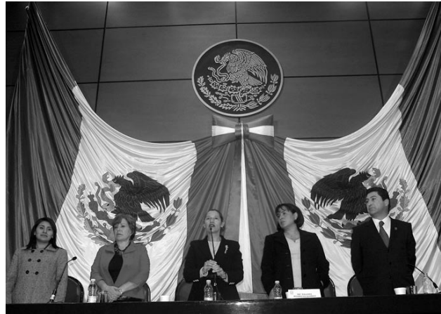
Comisión de Equidad y Género, Clausura del Congreso Nacional Legislativo a Favor de las Mujeres, noviembre 2008.

La declaratoria inaugural estuvo a cargo del diputado Javier Gonzáles Garza, presidente de la Junta de Coordinación Política (Jucopo) de la Cámara de Diputados, quien manifestó sentirse contento por los esfuerzos de las mujeres que han venido poniendo en claro los problemas de la desigualdad en la sociedad; reconoció el arduo trabajo de cada una de las integrantes de la Comisión de Equidad y Género quienes han sabido introducir los temas de igualdad en muchos programas como el de la Defensa Nacional.