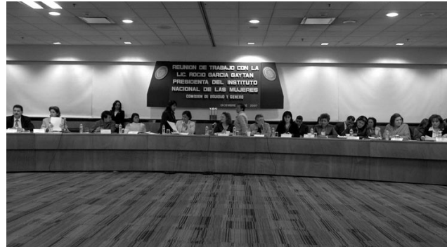
Comisión de Equidad y Género, LX Legislatura, 2007.

Mientras tanto, la Comisión tiene previsto festejar el X Aniversario de la CEG con un gran evento en el que espera reunir a la mayoría de las diputadas que han pertenecido a ella y a sus cuatro presidentas y así dar relevancia a un aniversario en pro de la equidad y la igualdad. ●