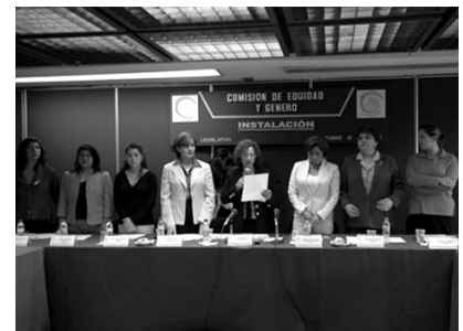
Instalación de la Comisión de Equidad y Género, LX Legislatura, octubre 2006.