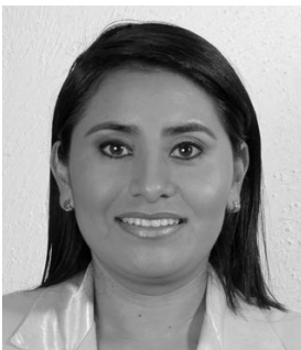
Dip. Guadalupe S. Flores Salazar PRD LX Legislatura

Con particular interés, el impulso de la incorporación de la perspectiva de género en el Presupuesto de Egresos de la Federación ha sido prioritario en el quehacer legislativo de la Comisión de Equidad y Género, ello ha permitido