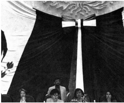
Comisión Especial para Asuntos de Equidad y Género, LVII Legislatura, durante el Parlamento de Mujeres, comisión especial de CEG, LVII Legislatura, 1998.

siempre y cuando produzca o se pretenda que tenga efectos en el extranjero.