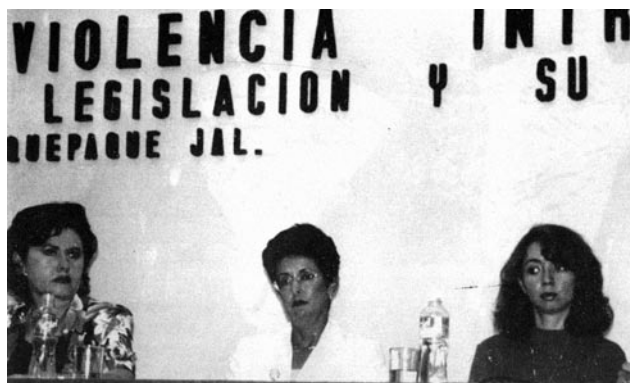
Integrantes de la Comisión Especial para Asuntos de Equidad y Género, LVII Legislatura, Primer Taller de Violencia Intrafamiliar, Legislación y su Aplicación, 1999.

592.2 millones de pesos, 16.9 por ciento más respecto al proyecto aprobado en 2007. Sin embargo, 74.5 por ciento de este incremento corresponde a los 441.0 millones que proyecta ampliar al Programa de Guarderías y Estancias