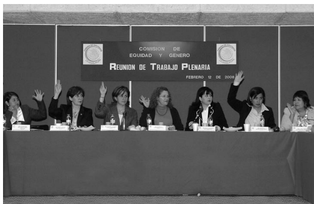
Mesa directiva, Comisión de Equidad y Género, LX Legislatura, 2008.

Los diez años de vigencia de la CEG reflejan el panorama del trabajo legislativo y parlamentario para crear una cultura