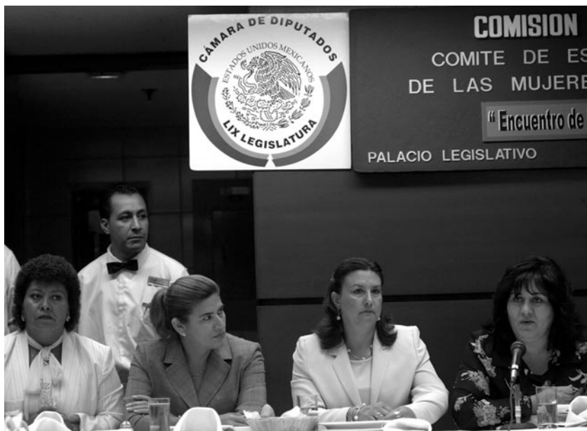
Reunión de legisladoras de la Comisión de Equidad y Género, LIX y LX Legislatura, 2006.

También se destacó que la contribución de la mujer en la familia y en la sociedad ha carecido del reconoci-