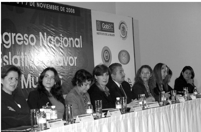
Comisión de Equidad y Género, Congreso Nacional Legislativo, Tijuana, BC. 2008.