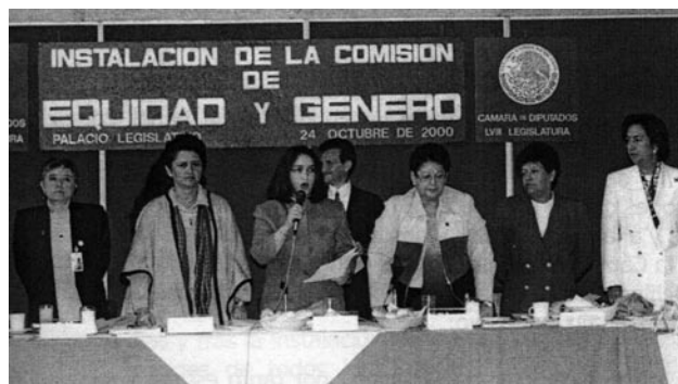
Instalación de la Comisión de Equidad y Género, LVIII Legislatura, 2000.